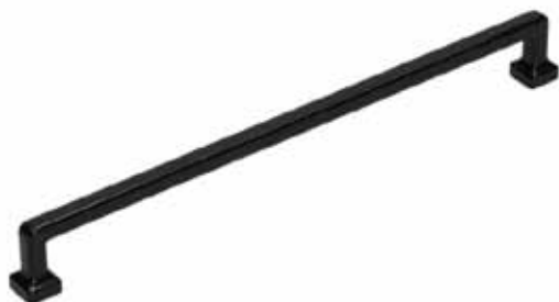
Gamet ručkica UR47