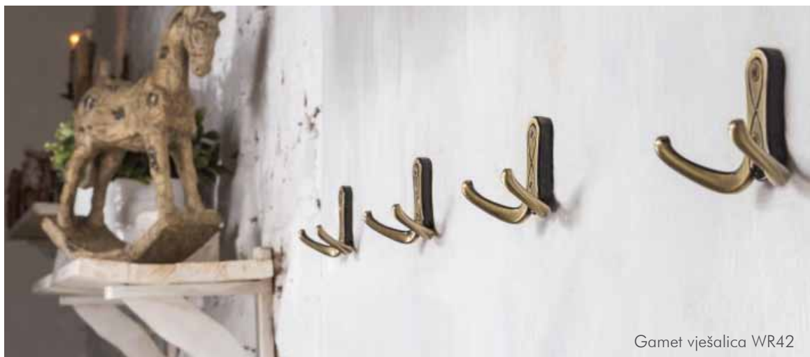
Gamet vješalice WR42

Max & Moris vam predstavlja nove Gamet ručkice dizajnirane do najmanjeg detalja. Uz ručkice, u ponudi možete pronaći i novu kolekciju Gametovih pomula i vješalica.