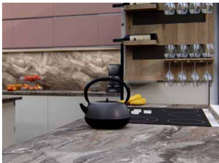
F094 ST15 Cipollino mramor crno bakreni

Danas se metalik boje mogu vidjeti na svim vrstama proizvoda - od automobila, preko mode pa sve do namještaja. Pri tome se koriste dekori s bogatstvom boja i dodatkom bisernih pigmenata, koji dočaravaju metalik izgled. Bakrena boja dočarava moderan materijal bakar u njegovom čistom obliku. Ovaj dekor se često kombinira s nordijski svijetlim vrstama drva i zato je prikladan za nordijski stil.