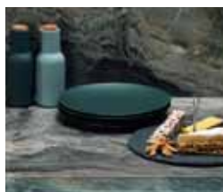
4 EGGER Preplitanje boja, uzoraka i struktura