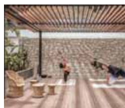
22 Spax Deking program