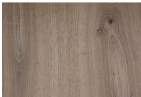
HRAST RUSTIC KNOTTY MDF

U ponudi Max & Morisa vas, uz postojeću ponudu Hrast quarter rift i Američki orah, očekuju novi furnirani MDF-ovi: Hrast rustic knotty i Hrast vintage svijetli. Furnirane MDF-ove nabavljamo od provjerenih dobavljača, a dolaze iz održivih i dobro upravljanih šuma.