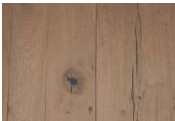
HRAST VINTAGE SVIJETLI MDF