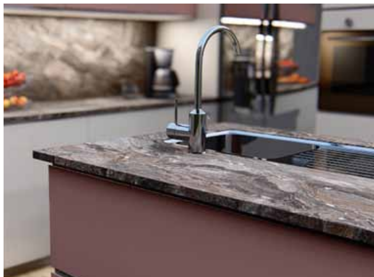
F570 ST2 Metalik bakrena