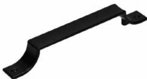
Gamet ručkica UU19