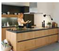
28 Furnirani MDF Vrhunski proizvod iz prirode