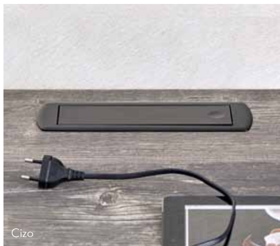
“Pop-up” ukopna utičnica CIZO

U prodajnom salonu Max & Morisa pogledajte kompletnu kolekciju utičnica i prateće opreme, uključujući tip-on utičnice, ugradbene utičnice s LED svjetlom, izvlačne utičnice, kapice, bežične punjače za mobitel i ostalu opremu.