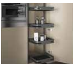
18 Sige Materia