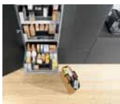
12 Blum Space tower