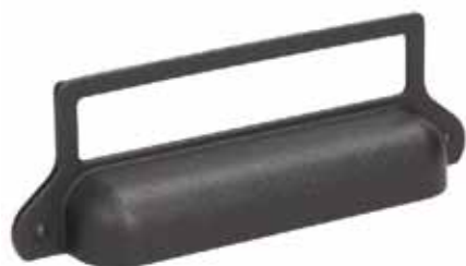
Gamet ručkica UP12

Ručkica nije više samo funkcionalni dio namještaja, već pojačava njegov umjetnički identitet i estetski upotpunjuje prostor. Zbog toga je odabir odgovarajuće ručkice izuzetno bitan u planiranju interijera. U ovome se u potpunosti možete osloniti na tvrtku Gamet koja vas svojim bogatim izborom modernih i kvalitetnih ručkica zasigurno neće razočarati.