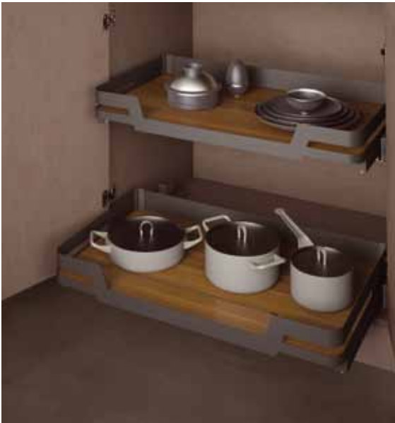
119ME - Izvlačne police s čvrstom osnovom, metalnim bočnim stranicama i staklenim umetcima, drvenim dnom i klizačima s potpunim izvlačenjem. Soft close zatvaranje.