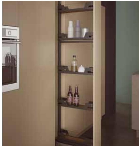
258ME - Mehanizam za izvlačenje košara sa soft close zatvaranjem. Pet košara s čvrstom osnovom, metalnim bočnim stranicama i staklenim umetcima te s drvenim dnom. Nosivost 80kg.