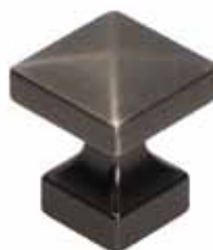
Gamet pomul GR47