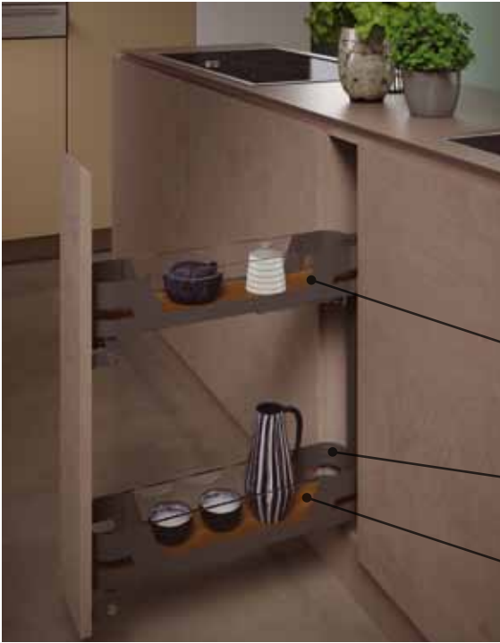
002ME - Izvlačne košare s čvrstom osnovom, metalnim bočnim stranicama i staklenim umetcima, drvenim dnom i klizačima s potpunim izvlačenjem. Soft close zatvaranje.