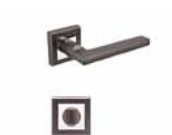
32 dopuna MM asortimana

* Slike su informativnog karaktera. Boje u tisku mogu odstupati od stvarnog stanja.