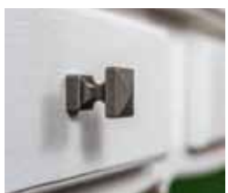
24 Gamet Ručkice sa stilom