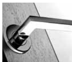
30 Kvake Ukras u interijeru